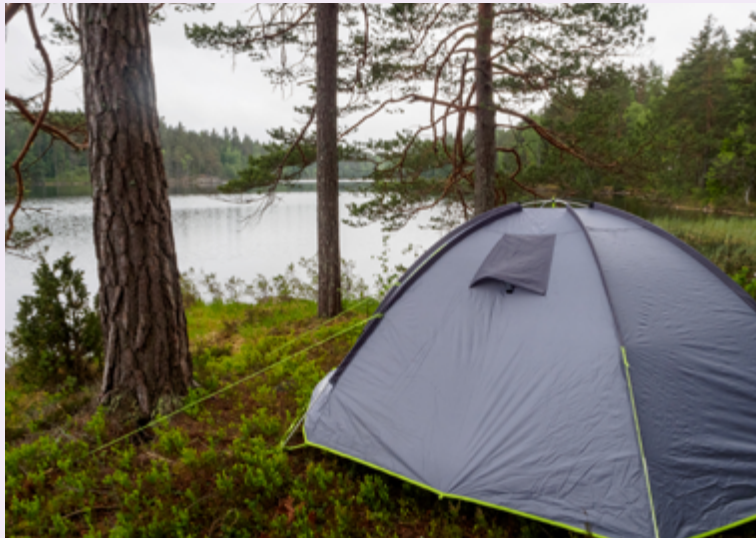
Allemansrätten är en mycket gammal tradition som är skyddad i grundlagen.

Den omfattande svenska allemansrätten skyddas i regeringsformen. Den säger vad man får och inte får göra ute i naturen. Allemansrätten ger alla möjlighet att vara i naturen oavsett vem som äger marken. Det går bra att gå, cykla, paddla, sätta upp tält, göra upp eld och plocka bär, svamp och blommor. Men det gäller att vara ansvarsfull och inte skada naturen eller störa markägaren. Det är till exempel inte tillåtet att gå på bondens åkrar, gå in i någon annans trädgård eller kasta skräp i naturen. Vissa växter är ovanliga och skyddas av lagen. Dem får man inte plocka.