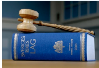
Lagboken med Sveriges rikets lag.

Grundlagarna är svårare att ändra än andra lagar. Sverige har fyra grundlagar: regeringsformen, tryckfrihetsförordningen, yttrandefrihetsgrundlagen och successionsordningen.