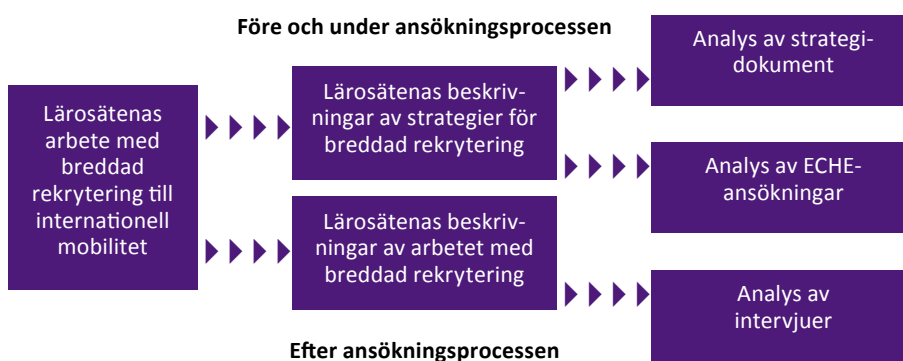
Figur 1: Övergripande analytisk ram

Analysen av lärosätens strategidokument och handlingsplaner för internationaliseringsarbetet har två huvudsakliga inriktningar. För det första att utgöra underlag för urvalet av lärosäten och framför allt skapa ett sammanhang för övriga metoder i utredningen att utgå från. För det andra att klargöra på vilket sätt arbetet med breddad rekrytering till internationell mobilitet kopplas till annan breddad rekrytering och framför allt till lärosätets internationaliseringsarbete.